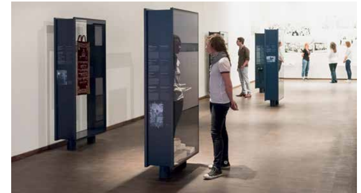
Blick in die Dauerausstellung View of the permanent exhibition room

The first installation VOICES highlights Jewish families and individuals who arrived in Munich over the past 200 years. Each of the audio tracks introduces the story of a person's life which led them to Munich, even if only for a few years. The installations PLACES and PICTURES illustrate the different lifeworlds and activities which Munich's Jews developed for themselves—ranging from a Nobel Prize Winner in Chemistry to emigrants and the congregation's rabbis. The exhibition section RITUALS provides an introduction to religious traditions in the family and in the synagogue by means of Jewish ritual objects and takes a look at Jewish festivals and religious holidays as well. A COMIC by the illustrator Jordan B. Gorfinkel focuses on the beginnings of a new Jewish life after 1945 up to the present day.