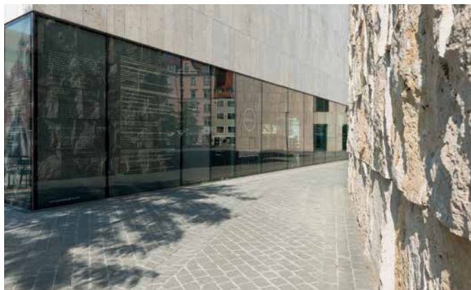
Jüdisches Museum München und Synagoge Ohel Jakob (Wandel Hofer Lorch Architekten 2006/2007) The Jewish Museum Munich and the synagogue Ohel Jakob built in 2006/2007

Eran Shakine: A Muslim, a Christian and a Jew