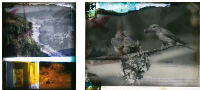
Dana Flora Levy Lightbox Collages, 2025