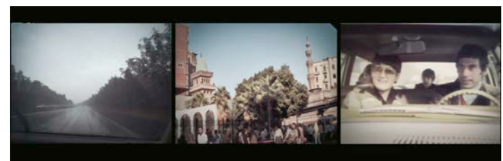
Dana Flora Levy This Was Home, 2016