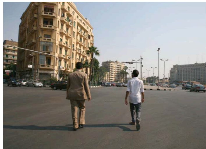
Tamir Zadok The Man in the Suit, 2017

Begleitend zur Ausstellung bieten wir an: