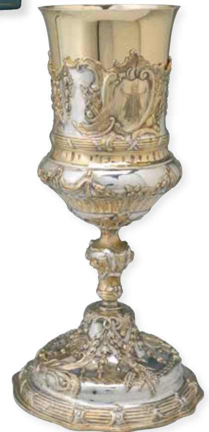
6 Pokal von Ignatz Franzowitz Cup by Ignatz Franzowitz München, nach | Munich, after 1765