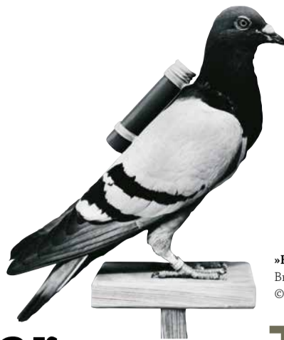
»Kommt ein Vogerl geflogen« Brieftaube