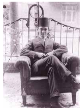
»Das Andere Europas« Lew Nussimbaum, alias Essad Bey, aka Kurban Said, Berlin, um 1923