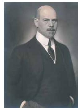
»Idee Europa« Walther Rathenau, vermutlich Berlin, ca. 1920