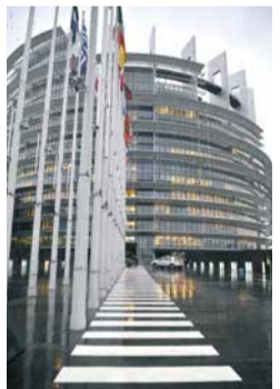
»Union Europa« Europäisches Parlament, Louise-Weiss-Gebäude

PROJEKTLEITUNG | PROJECT MANAGEMENT Hanno Loewy KURATORINNEN | CURATOR Felicitas Heimann-Jelinek, Michaela Feurstein-Prasser, Wien PROJEKTKOORDINATION | PROJECT COORDINATION Lilian Harlander IN ZUSAMMENARBEIT MIT | IN COLLABORATION WITH Sarah Steinborn AUSSTELLUNGSARCHITEKTUR | EXHIBITION ARCHITECTURE Martin Kohlbauer, Wien