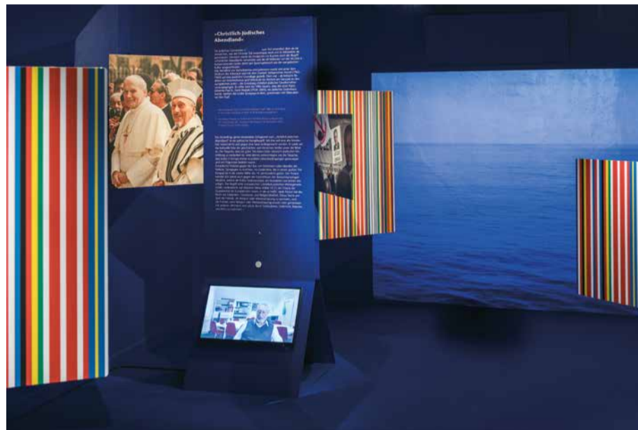
»Christlich-jüdisches Abendland« Ausstellungsansicht